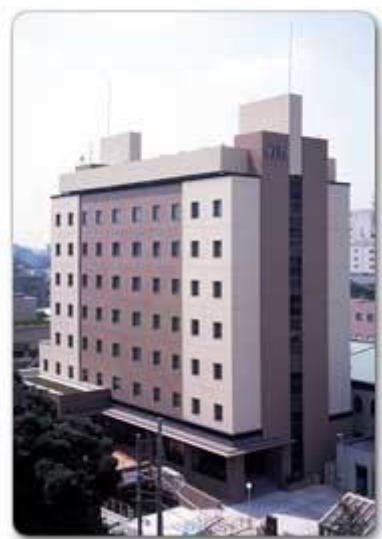
ホテルメッツ目白

場所：今年は、会場を変えて、目白駅を出て、すぐ右隣です。 ホテルメッツ目白3F カフェ「フィオレンティーナ」