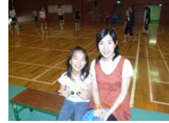
会場には、子供連れでの参加の姿も目に付きました。