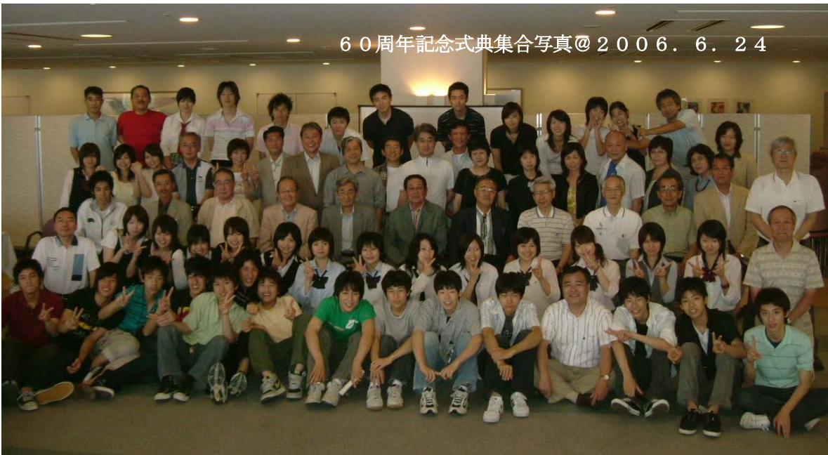
60周年記念式典集合写真@2006. 6. 24