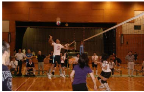
ジャンプ x xメートルで昔はすばらしいアタックだったが・・・