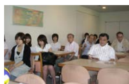
活動報告、会計報告、新コーチ承認等が報告され、承認された。