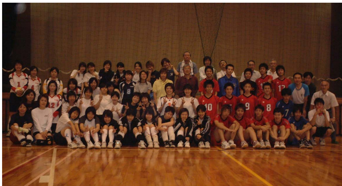
体育館での試合後集合写真@2004. 6. 19