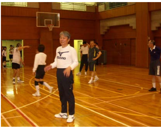
オールド OB があまり動かなくても参加し、楽しめるよう OB/OG は9人制でやると言う試みも来年は欲しいとの意見もありました。