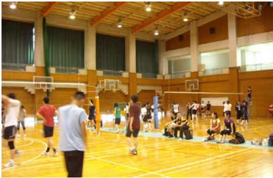
OB/OG と女子との試合もありました。