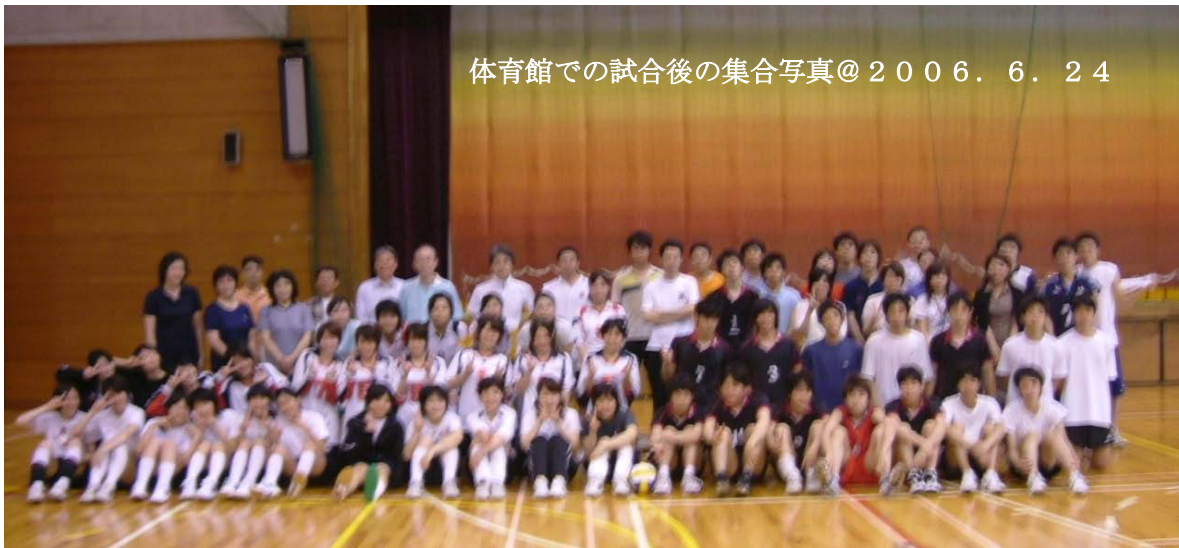
体育館での試合後の集合写真@2006. 6. 24